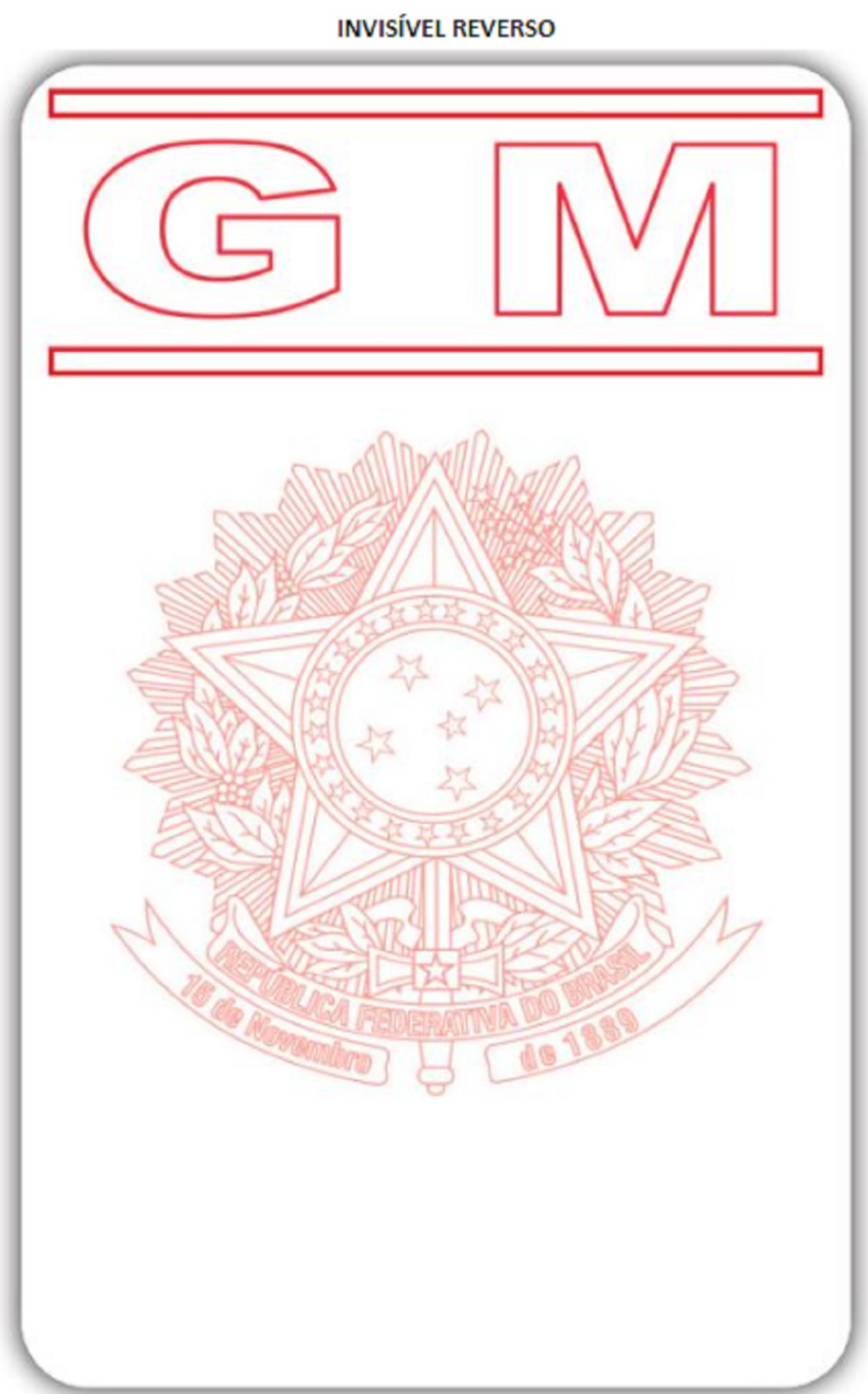
MODELO SERVIDOR DA ATIVA