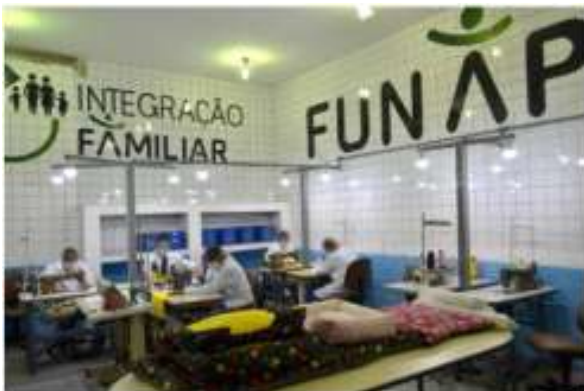
Artigos da linha PET (camas, cobertas, roupas, tapetes)