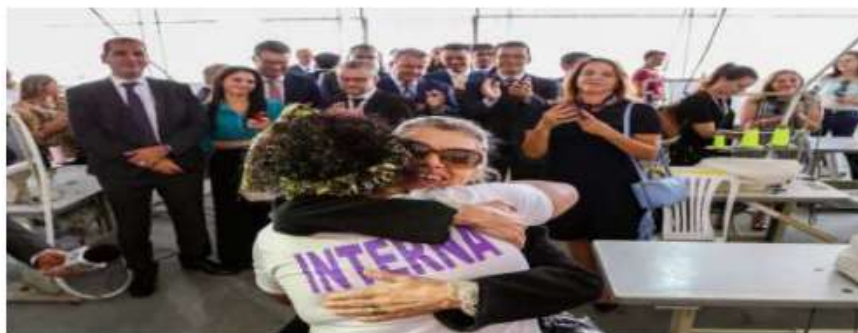
Visita da Ministra Carmen Lúcia ao Projeto