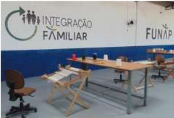
Artigos de linha têxtil produzidos em tear