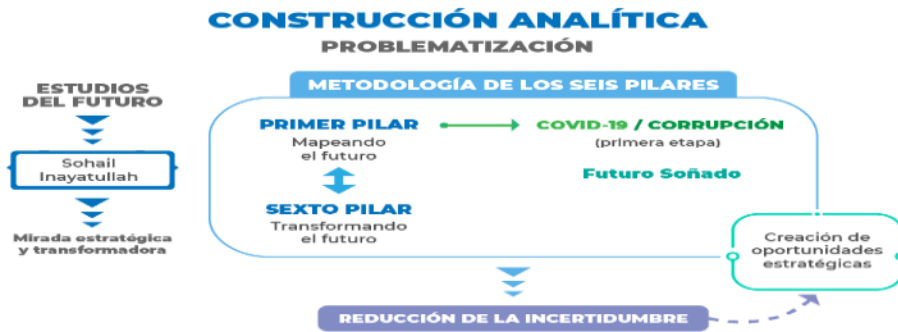
Gráfico 2. Construcción analítica