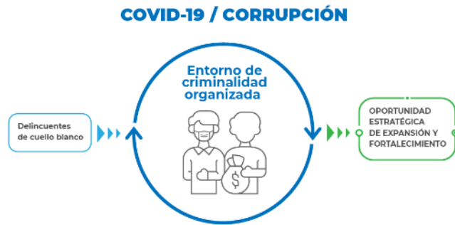
Gráfico 1. Coronavirus 19 en Ecuador y delincuencia de cuello blanco

como a la práctica (RODRÍGUEZ; RODRÍGUEZ, 2019).