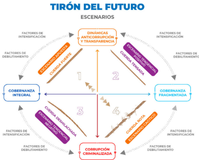
Gráfico 5: Escenarios de doble variable