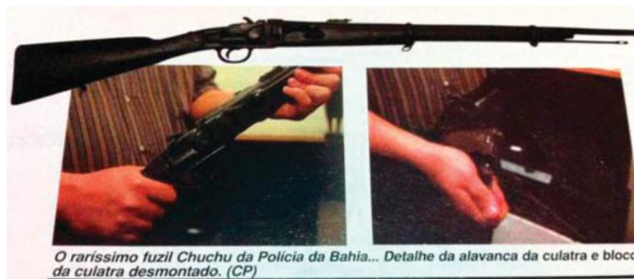
Figura 4 - Fuzil “Chuchu” da Polícia da Bahia.