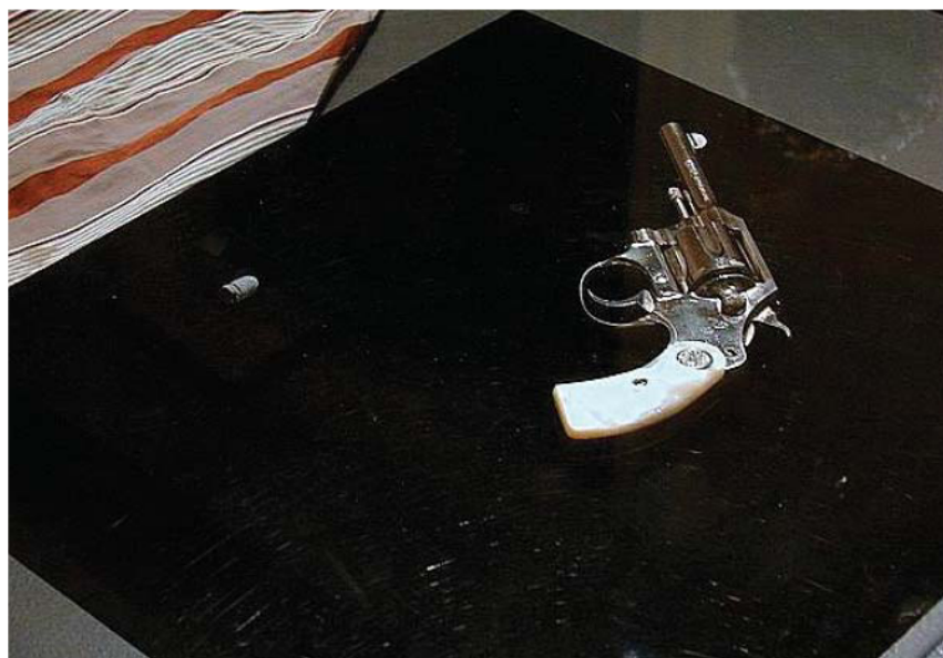
Figura 2 - Revólver Colt , calibre 32, cano longo, utilizado por Getúlio Vargas no seu suicídio.