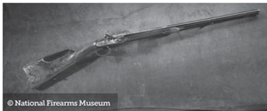
Figura 3 - Espingarda C 1800, apresentada por Napoleão Bonaparte ao Marquês Faulte.

Não obstante, além da raridade da peça, uma arma de fogo ainda pode ter seu valor histórico relacionado ao seu uso em determinado evento histórico, de repercussão regional, nacional ou mundial. Exemplo é a espingarda C 1800 (Figura 3), com acabamento personalizado, apresentada por Napoleão Bonaparte ao Marquês Faulte de Vanteaux de Limoges, general de seu exército. A arma está exposta no museu da NRA, na cidade americana de Springfield, Massachusetts.