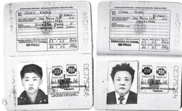
Figura 2 – Passaportes brasileiros que teriam sido emitidos para Kim Jong-un e seu pai, Kim Jong-il. Detalhe para a foto que era colada e os dados nominais escritos a caneta. Fotos: Handout via Reuters (G1, Brasília, 2018). Disponível em: https://g1.globo.com/mundo/noticia/lider-da-coreia-do-norte-kim-jong-un-teve-passaporte-emitido-no-brasil-diz-itamaraty.ghhtml . Acesso em: 07.abr.2020.