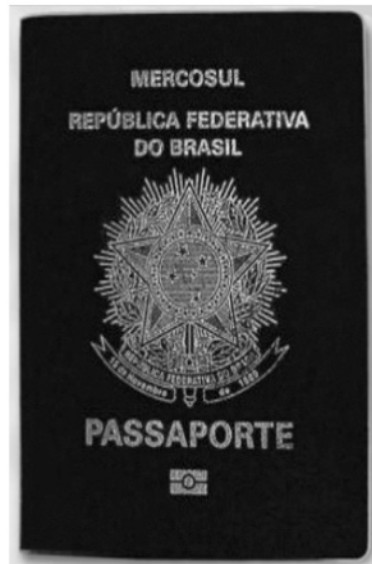
Figura 3 – Novo passaporte que além de inúmeros itens de segurança, contém chip que permite agregar a biometria do portador, como foto e impressões digitais.