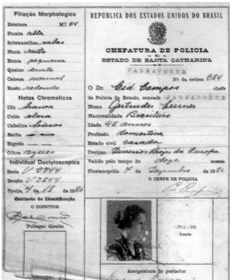
Figura 01 – Passaporte emitido em 1926 pela Secretaria de Segurança Pública de Santa Catarina, onde constava campo para fotografia de frente e perfil, elementos físicos morfológicos e notas cromáticas, assinatura e impressão digital do polegar direito.